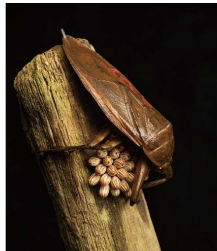
図 1: 卵を保護するタガメのオス。

このような状況から、熊本県立大学の一柳英隆 学術研究員は、熊本県南部地域のタガメの保全に取り組んでおり、熊本県南部で唯一知られていたタガメの生息地(「保全地①」)の個体数を安定的に維持できるように、生息環境の改善などを実施してきました。さらに一柳 学術研究員は、「保全地①」の個体を 17.3 km 離れた「保全地②」に移植し、新たなタガメの集団を創設する試みも進めてきました(図 2)。