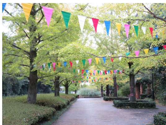
11月2日は大学祭準備のため、ハーモニーロードに飾り付けをしています