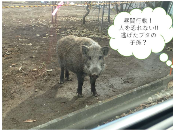
図 1. 昼間に行動し、自動車も恐れなかった帰還困難区域のイノシシ

平成 23 年 3 月の東北地方太平洋沖地震によって発生した津波と東京電力福島第一原子力発電所の事故に伴う放射能汚染により、広範囲で人間の生活が規制されました。住民の避難や作付け制限によって空き家や耕作放棄地、放任果樹等が生じ、様々な野生哺乳類の個体数が増加しました。さらに、逸出後に野生化した家畜のブタが野生のニホンイノシシと交雑していること、逸出したブタを母方の祖先に持つイノシシが分布を拡大している可能性があること等が、福島県内のニホンイノシシを対象としたミトコンドリア DNA の分析により明らかになっていました。しかし、イノシシの形態や生態等に大きな影響を与える核 DNA の分析は行われておらず、家畜ブタ遺伝子の核 DNA における拡散状況については不明なままでした。