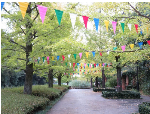
11月2日、3日は大学祭の関係で飾り付けしています。