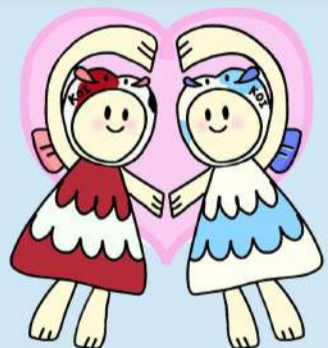
オリジナルキャラクター こーたん&いーたん

スタートは池清掃。 今では輝くステージへ変身！ 地元の子どもたちにとっては 嬉しいイベントです。