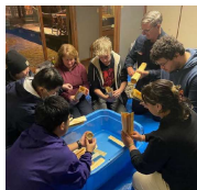
参加した 外国人観光客