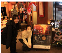
学生作成ポスター