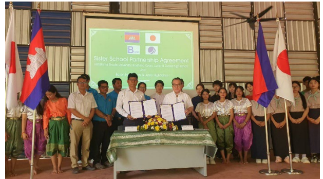
調印を終え、記念写真を撮りました。