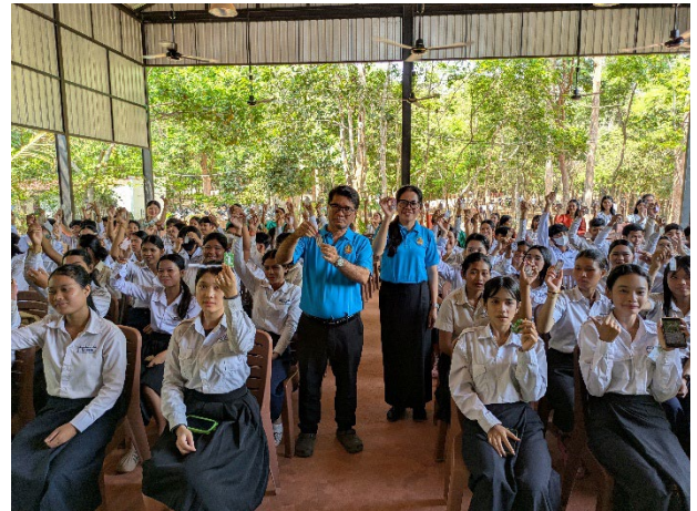
みなさんに喜んでいただいた「水引付お守り」