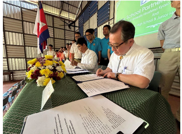
両校長が調印書にサインをしました。

翌22日(日)早朝、アンコールワットに行きました。運よく晴天に恵まれ、彼岸のご来光を目にすることができました。最高の出会いでした。