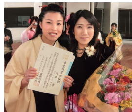
▲ 卒業式でのゼミの先生との記念写真

水泳以外では、フランクで楽しいゼミの先生や、ゼミの仲間と過ごした時間が心に残っています。今でも広島に帰省した時はよく会う、大切な仲間です。