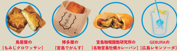
鳥居屋の【もみじクロワッサン】 博多屋の【宮島でがらす】 宮島咖喱麵飽研究所の【名物宮島牡蠣カレーパン】 広島レモンソーダの【GEBURA】