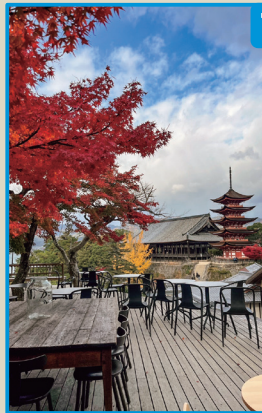
※五重塔は2026年5月現在、修復工事中