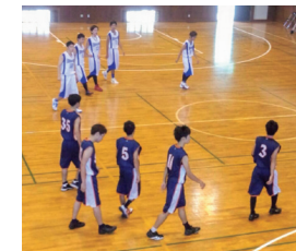
▲ サークルで試合に出場した時の写真

卒業後は教員ではなく一般企業に就職しましたが、現在は縁あって広島のプロバスケットボールチームで働き、また違った形でバスケットに関わっています。