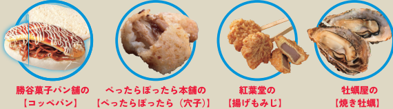
勝谷菓子パン舗の【コッペパン】 べったらばったら本舗の【べったらばったら(穴子)】 紅葉堂の【揚げもみじ】 社蠟屋の【焼き社蠟】